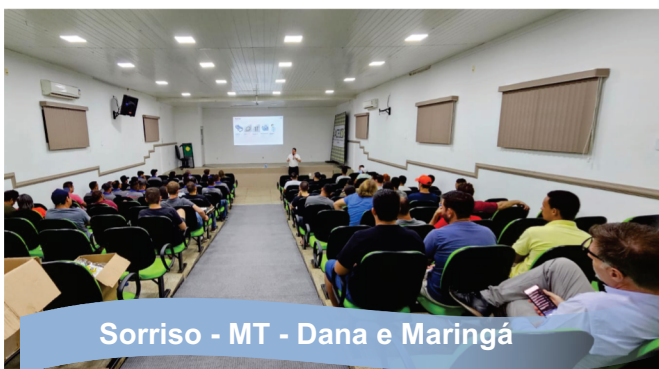
Sorriso - MT - Dana e Maringá