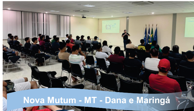
Nova Mutum - MT - Dana e Maringá