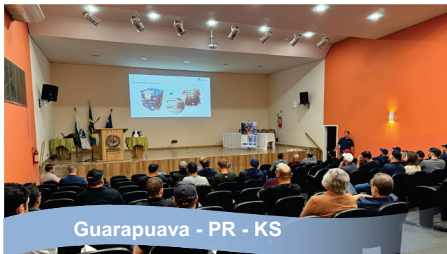
Guarapuava - PR - KS