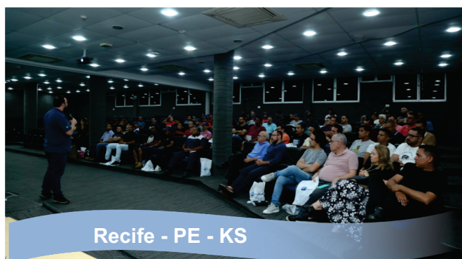
Recife - PE - KS