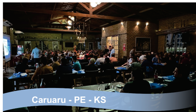
Caruaru - PE - KS