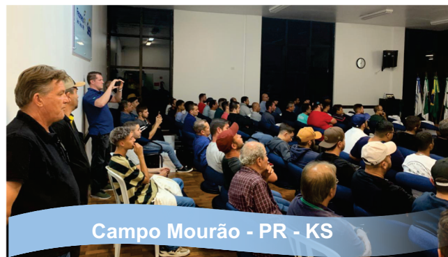
Campo Mourão - PR - KS