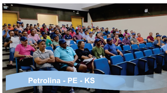
Petrolina - PE - KS