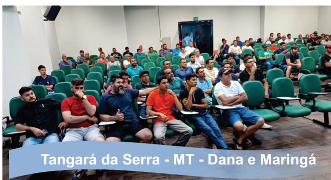
Tangará da Serra - MT - Dana e Maringá